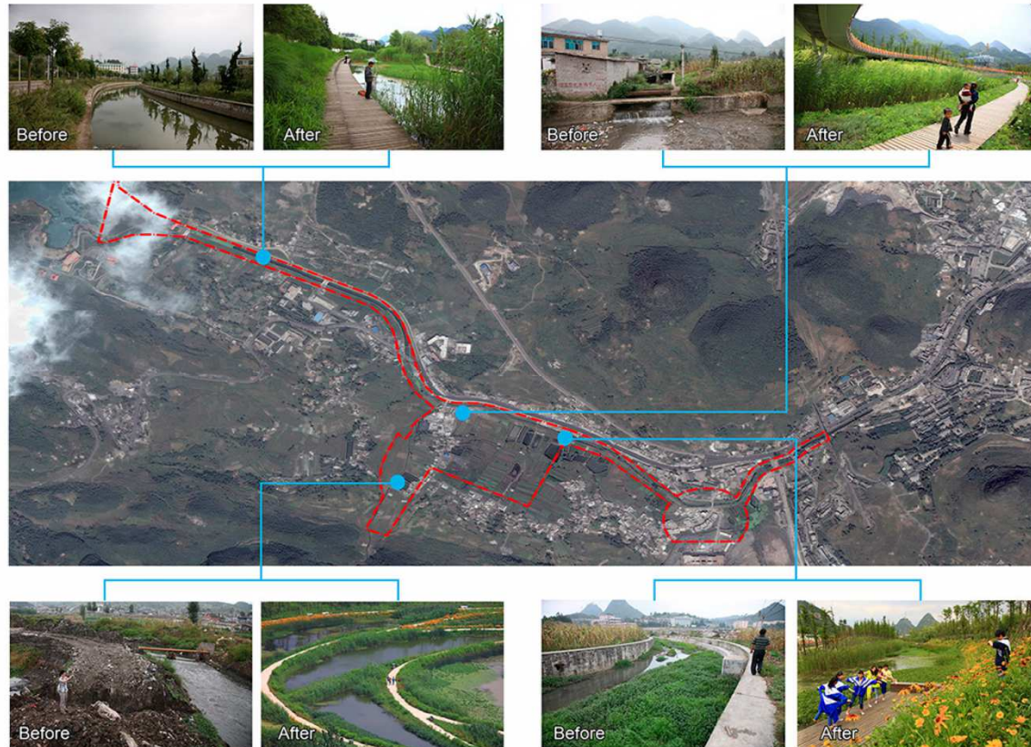
Figura 5. Parque de humedales Liupanshui Minghu, obra realizada por Turenscape en la ciudad de Liupanshui, la cual es atravesada por el río Shuichenghe. Se muestran imágenes del manejo y transformación de varios humedales. Puede verse como fueron transformados desde el punto de vista funcional y ahora conforman un conjunto de humedales urbanos que proporcionan servicios ecosistémicos a los habitantes, siendo el de recreación uno de los principales, junto con la reducción de inundaciones y la alimentación del manto freático.

confirma su contribución positiva a la gestión de inundaciones y la marca de ciudad. 17 de las 31 ciudades esponja piloto registraron la mayor cantidad de publicaciones relacionadas con ciudades esponja. Otras ciudades con más publicaciones de Weibo sufrieron lluvias e inundaciones, como Xi'an y Zhengzhou. Su originalidad y valía son, de acuerdo con los autores, que este estudio es el primero en explorar la percepción pública de la ciudad esponja en Sina Weibo."