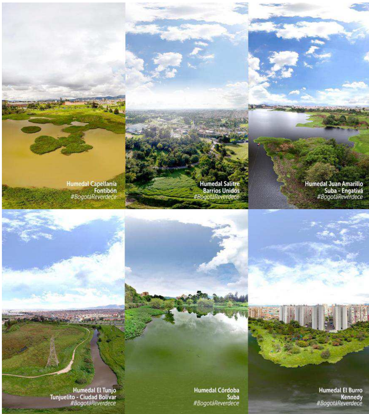
Figura 6. Ejemplo de seis humedales urbanos en Bogotá, Colombia

oficialmente la Misión de Humedales, mediante la cual un grupo de expertos asesorará a la Alcaldía en el manejo de más de 15 humedales urbanos que hay en la capital (Figura 6). ( https://www.kienyke.com/bogota/arranca-la-mision-de-humedales-en-bogota ).