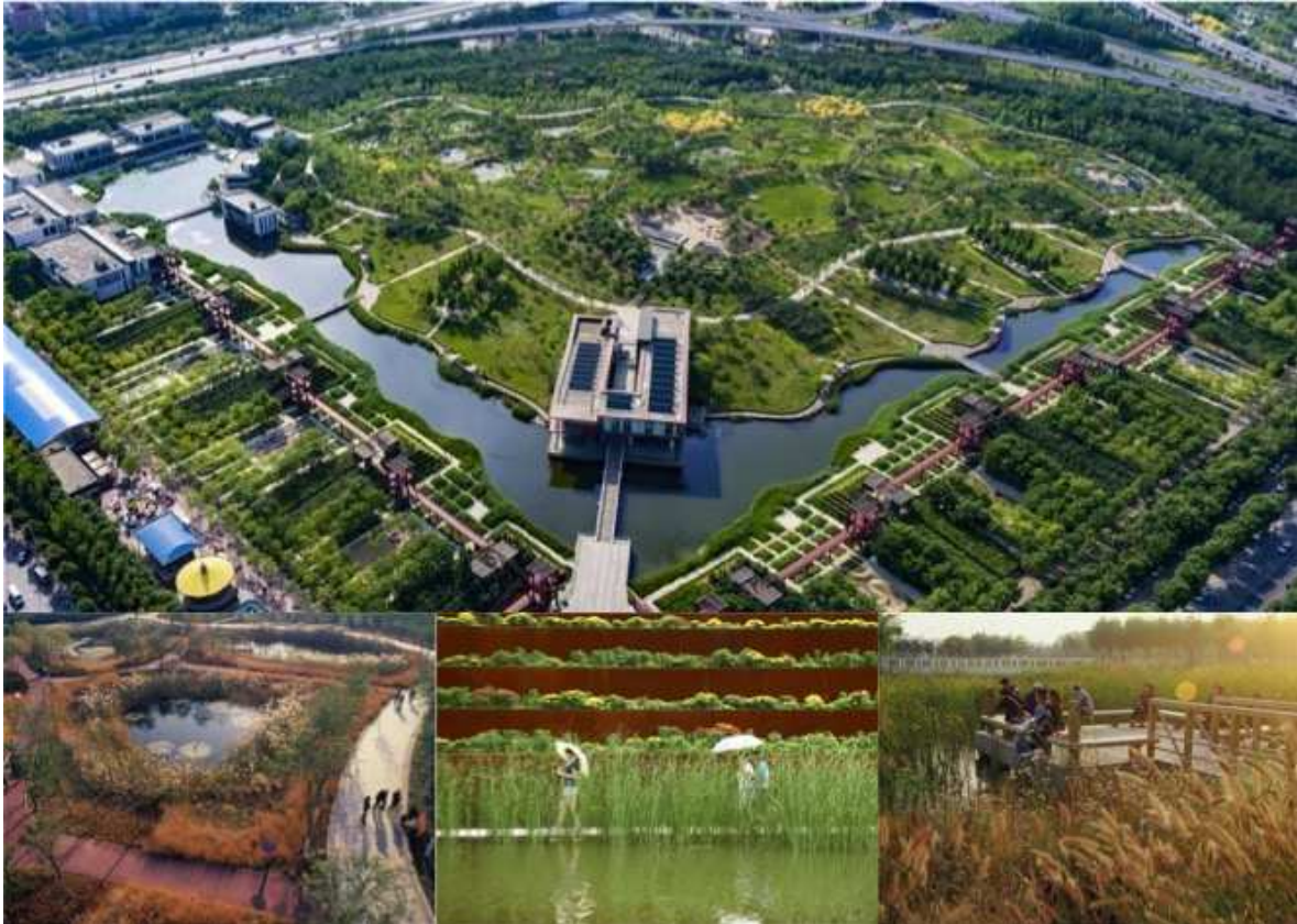
Figura 4. Parque de Qiaoyuan en el distrito de Hedong, en la ciudad de Tianjin en China, diseñado por los arquitectos de Turenscape. Se integró un proyecto con funciones ecológicas regenerativas en predios que habían sido depósitos de basura y en zonas degradadas, usando plantas nativas en un paisaje que puede ir adaptándose y evolucionando y que educa a los visitantes en espacios de relajación diseñados para zonas densamente habitadas de los alrededores

Una ciudad esponja es un nuevo modelo de construcción urbana desarrollado para la gestión de inundaciones, que se enfoca en fortalecer la infraestructura ecológica y los sistemas de drenaje. Se considera como una forma de manejo integral específico del agua en ambientes urbanos (Nguyen et al., 2019). Fue propuesto por investigadores chinos a principios de 2000 y fue aceptado como política de urbanismo en China en 2014 (Figura 4) (Zeng et al., 2023).