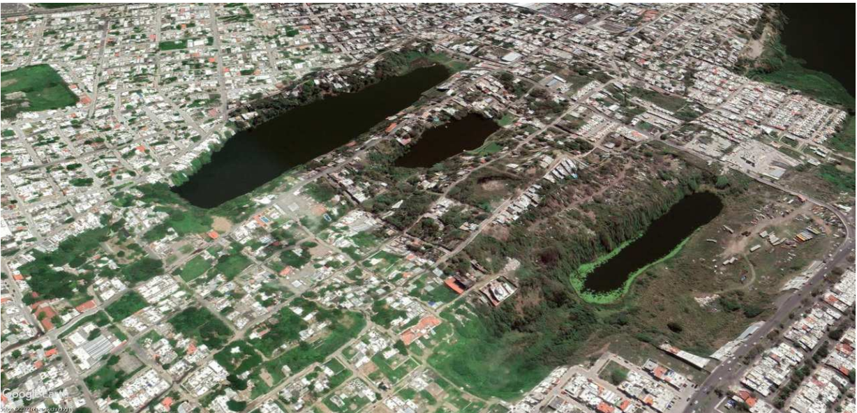
Figura 2. Vista de algunas lagunas interdunarias en las partes bajas entre los cordones de dunas, en la ciudad de Veracruz. La imagen se obtuvo de Google Earth y el eje Y está exagerado para poder percibir la topografía donde se asienta la ciudad de Veracruz y la ubicación de las lagunas que forman parte del ANP y del sitio Ramsar (Elaboración, R. Monroy-Ibarra)

recreación, y los habitantes comienzan a disfrutar y reconocer su importancia como parte de su entorno. Ello representa un cambio de paradigma con respecto a ver a los humedales como zonas de aguas estancadas, malolientes y donde se crían mosquitos que transmiten enfermedades. Este cambio de visión tiene que transformarse en modificaciones en los permisos de construcciones, regulaciones que eviten la desecación y relleno de humedales urbanos y medidas de gestión y protección que garanticen su conservación y el que sigan proveyendo de servicios ecosistémicos. Un ejemplo de esto es el Área Natural Protegida, ANP10, Corredor Biológico Multifuncional Archipiélago de Lagunas Interdunarias de la Zona Conurbada de los Municipios de Veracruz y La Antigua y Sitio Ramsar de Lagunas Interdunarias de la Ciudad de Veracruz (número 1450). Está conformado por más de 30 lagunas interdunarias de agua dulce, que se ubican en las partes bajas entre los cordones de dunas (Figura 2). Existieron más de 100 en algún momento y lograron rescatarse 36 que conforman el ANP y el sitio Ramsar. La mayoría están rodeadas de urbanizaciones de alta densidad y se ha logrado a la fecha definir su perímetro y evitar invasiones y eliminar las entradas clandestinas de agua negras. Subsisten otros problemas como el crecimiento de plantas acuáticas desmedido, lo que implica un programa constante de mantenimiento, o las entradas de aguas pluviales que acarrear basura y contaminantes.