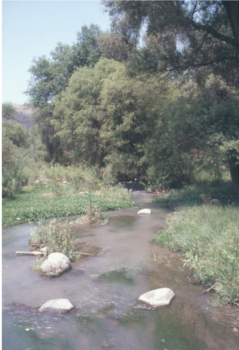
Fig. 3. Río El Pueblito con bosque en galería de Salix y Fraxinus . La sumergida es Zannichellia palustris .