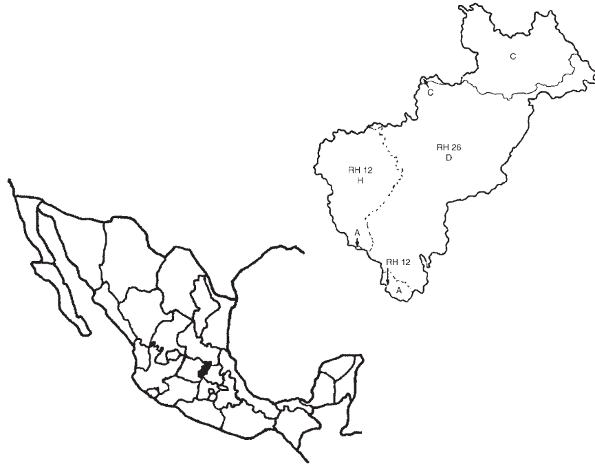
Fig. 1. Localización del estado y cuencas principales. RH 12: región hidrológica del Lerma–Chapala–Santiago; A es la cuenca del río Lerma–Toluca y H es la del río Laja. RH 26 es la región hidrológica del Pánuco; C es la cuenca del río Tamuín y D es la cuenca del río Moctezuma. Adaptado de Anónimo (1986).

(Zamudio et al., 1992), una diversidad mayor a la de toda la península de Yucatán, Guanajuato o Coahuila.