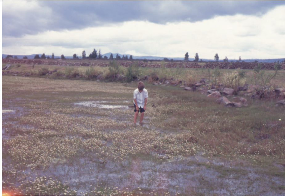
Fig. 4. Charco temporal en la zona de Amealco–Huimilpan en noviembre.

Myriophyllum hippuroides , Najas guadalupensis , Potamogeton diversifolius , Sagittaria demersa , Crassula aquatica , Zannichellia palustris son las enraizadas sumergidas y entre las de hojas flotantes se colectaron Bacopa rotundifolia , Callitriche heterophylla , Hydrochloa caroliniensis , Marsilea mollis y Nymphoides fallax . Como hidrófita libre sumergida califica Utricularia perversa y tampoco faltan las libres flotadoras Azolla filiculoides y Lemna aequinoctialis , aunque éstas últimas no se presentan todos los años y su distribución es muy localizada. A algunas de las plantas usualmente sumergidas como Sagittaria demersa o Myriophyllum hippuroides se les observan hojas fuera del agua, sobre todo hacia el final de la estación de crecimiento cuando el nivel de los embalses empieza a bajar. La riqueza florística más alta de uno de los charcos grandes llega a 31 especies de acuáticas y subacuáticas, mientras que en los cuerpos de agua menos diversos se han encontrado únicamente dos, el total correspondiente a la región de Amealco y Huimilpan suma 34 especies.