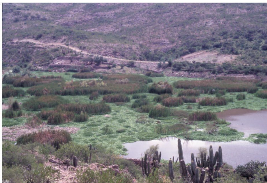
Fig. 5. Presa de la Soledad en Colón infestada por Eichhornia y Typha .

Vegetación de presas y canales de riego: Las presas de Colón, La Llave y Rayas presentan fuertes invasiones de Eichhornia y Typha (Fig. 5). En los canales de desagüe de los reservorios se encontró mayor diversidad de plantas acuáticas, sobre todo en el de Rayas y de Constitución de 1917, donde prospera el arbusto Heimia salicifolia y entre las hidrófitas enraizadas emergentes crecen Eleocharis sp., Hydrocotyle ranunculoides , Juncus sp., Lilaeopsis schaffneriana , Mimulus glabratus , Paspalum dilatatum , Rorippa nasturtium-aquaticum y Typha latifolia . Como planta sumergida sólo se encontró a Zannichellia palustris , y de las libres flotadoras a Azolla filiculoides , Eichhornia crassipes , Lemna gibba y Wolffia columbiana . Las hidrofitas de tallos postrados están representadas por Heteranthera reniformis y Ludwigia peploides .